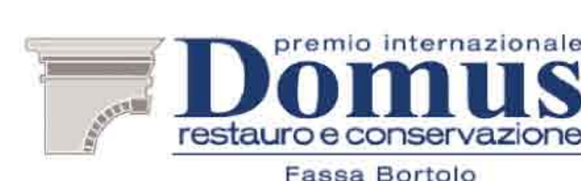
Tavola rotonda "ARTE E RESTAURO: RIFLESSIONI SUL CONCETTO DI CREATIVITÀ NEL RESTAURO ARCHITETTONICO"

Tavola rotonda a cura di LaboRA, Dipartimento di Architettura, Università degli Studi di Ferrara