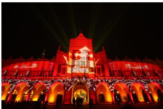
Palazzo dei Tessuti, Cracovia

in onore della città di Cracovia, al cui gemellaggio con Firenze la Fondazione ha attivamente contribuito.