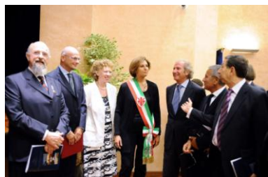
Prima della cerimonia

La sala Anfiteatro dell'Auditorium al Duomo di Firenze è stata intitolata, su iniziativa della Fondazione Romualdo Del Bianco®, ad Andrzej Tomaszewski. La cerimonia si è svolta mercoledì 14 settembre negli spazi dell'Auditorium al Duomo (Via de' Cerretani 54/r).