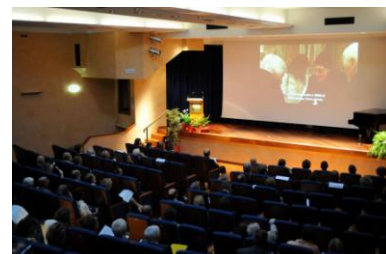
Proiezione del documentario

Architetto polacco, storico dell'arte e archeologo, già membro del Comitato Internazionale degli Esperti della Fondazione Romualdo Del Bianco® e titolare di prestigiose cariche in seno a UNESCO, ICCROM, Consiglio d'Europa, Ministero della Cultura Polacco, ICOMOS, ICOM ed altre ancora, Tomaszewski – profondo conoscitore ed amante di Firenze - ha contribuito attivamente alla conservazione del patrimonio culturale e al dialogo tra culture, impegnandosi in prima persona. I valori nei quali Tomaszewski ha creduto profondamente sono, oggi, parte essenziale dell'orientamento Life Beyond Tourism®, promosso dalla Fondazione Romualdo Del Bianco® allo scopo di sviluppare conoscenza tra i popoli, incontri tra culture, valorizzazione dei territori e sviluppo di un vero e proprio 'turismo dei valori'. La Fondazione ha dunque voluto rendere omaggio a Tomaszewski per il contributo fondamentale suo e della Polonia in questo percorso.